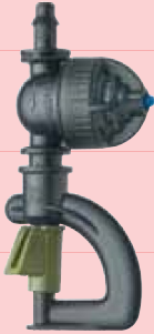
Modulaire inversé turbine verte avec Super LPD basse pression noire