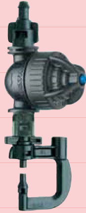
Hadar 7110 brumisateur avec Super LPD baïonnette