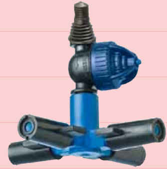
Foggers en croix avec Super LPD 3/8'' haute pression